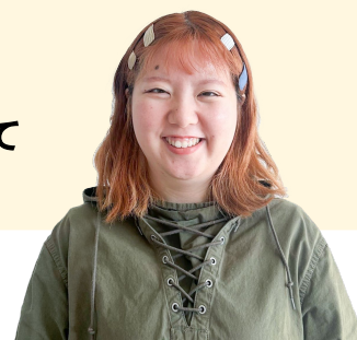
入社5年目 ネット事業部

そしてなにより、 自分の強みを活かして やりがいのある仕事 ができて 日々達成感があります！