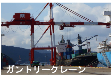
ガントリークレーン

当社では上記の様な特殊な重機を扱っております。機械好きで特殊な重機を扱いたい方はぜひ応募下さい。