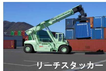
リーチスタッカー