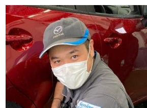
舞鶴店 整備 Kさん

整備の仕事は体力的に大変な仕事です。また、車は年々進化していきますので。知識習得はかせません。京滋マツダでは、経験や職種ごとの研修が多く実施されており、知識や経験を積むのに役立っています。