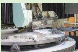
機械加工 (旋盤・溝など)