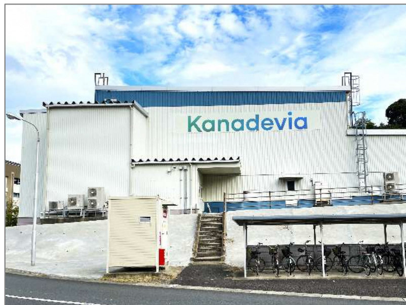
制御機器センター (舞鶴市)