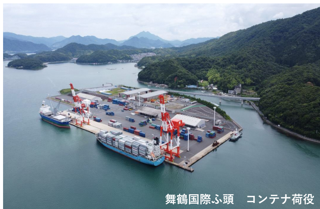
舞鶴国際ふ頭 コンテナ荷役

飯野港運グループは明治32年に創業し120年以上にわたり港湾運送事業及び船舶修理業に携わってきております。飯野港運では一般港湾運送事業の免許を擁し荷主や船社の依頼を受けここ京都舞鶴港に於いて、船舶からの貨物の陸揚げ、積み込み、受渡しやこれらに付帯にするサービスを一貫して提供しております。取り扱う貨物は石炭・コンテナ・木材加工製品・中古車等多種に及びます。和田造船では官公庁が所有する小型船舶を中心にメンテナンスや修理を行っております。