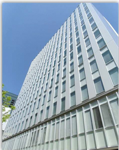
本社(大阪市中心部)