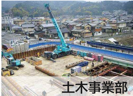
土木事業部 建築事業部

クレバリーホーム北京都店としてスタイリッシュかつ強度の高い住まいを提供しています。その他多くのリフォームや不動産相談等も承っています。