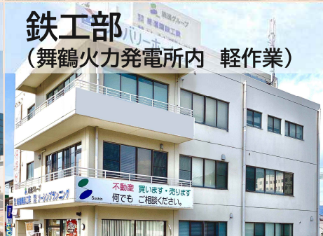
鉄工部 (舞鶴火力発電所内 軽作業)

公共建築物、民間事業所、店舗など街づくりに通じて、地域の豊かな暮らしの発展に貢献しています。